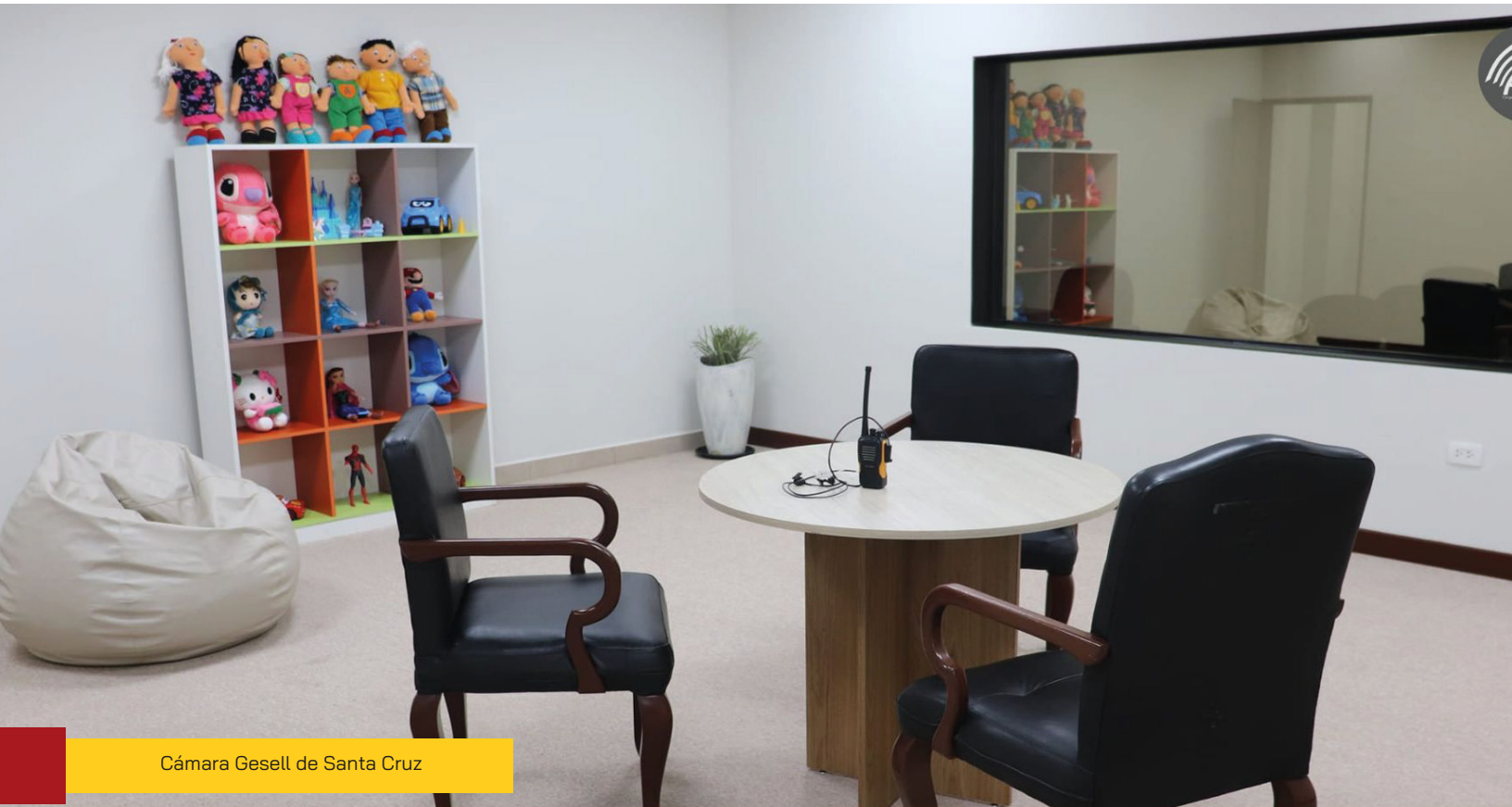
Cámara Gesell de Santa Cruz