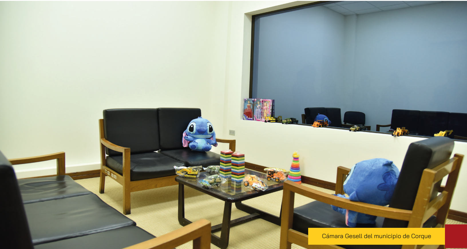
Cámara Gesell del municipio de Corque